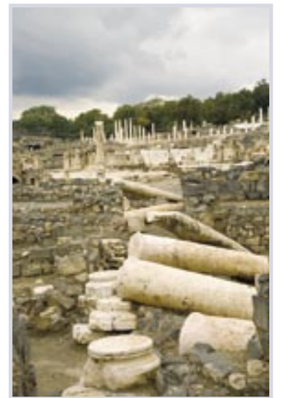
תמונת שער: הריסות העיר סקיטופוליס בעקבות רעידת אדמה בשנת 749, בית שאן.

הפקה: צוות היגוי ניהול כללי: עזרא מנגד יועץ מקצועי: אינג' מוטי יוגר יועץ ארגוני: אינג' יהודה ארציאלי רכזת מערכת: תמרה אברג'ל תחקירנית: אירית חבקין מחלקת שיווק: מרסל שמחי יועץ משפטי: עו"ד גינדיס עיצוב גרפי, קונספט וצילום: פני אלימלך עריכה לשונית והגהות: ענבל גיל הפקת דפוס: פני אלימלך- סטודיו פאן הדפסה: דפוס איילון מוציא לאור: "אבני דרך" צילומי כתבות: אינג' מוטי יוגר, פני אלימלך, מכאל רוזנפלד, חיים וינגרטן, פיקוד העורף ד"ר דורון שלו מידע לפרסומים: נא לפנות למערכת כתובת המערכת: רח' אקליפטוס 6 ת"ד 2303, קדימה מיקוד 60920. משרד: 09-8911401, פקס. 09-8911490 דו"אל: administration@bezeqint.net